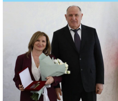
Указом Главы РД начальнику Управления образования г. Дербента

7 марта, в преддверии Международного женского дня, в Махачкале, в Доме дружбы, состоялась церемония вручения государственных наград и благодарностей.